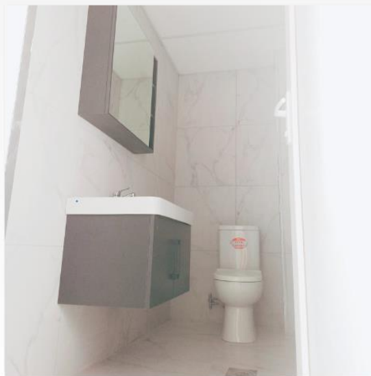
A F T E R