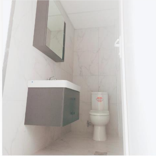
A F T E R