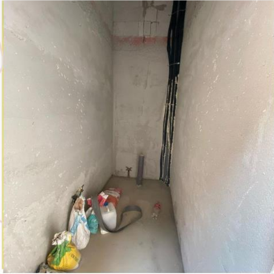
B E F O R E